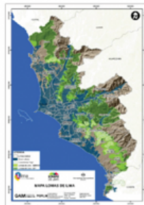
Lomas de Amancaes