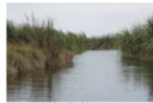
Pantanos de Villa